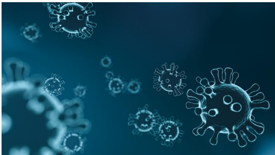
COVID19 © Tous droits réservés

Le Conseil d'Etat prend acte de la décision du Conseil fédéral, annoncée cet après-midi, de mettre fin aux régimes d'exception cantonaux. Le nouveau régime prendra effet ce samedi 9 janvier 2021, à 0h00 conformément à ce que prévoit l'ordonnance fédérale.